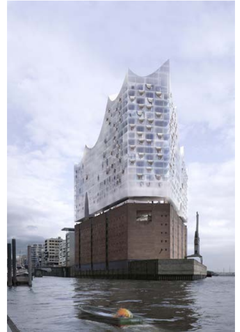
computergeneriertes Bild © Herzog & de Meuron